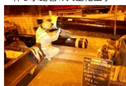
水路管の取替作業状況