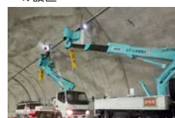
水噴霧設備の設置作業状況