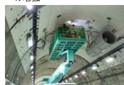
ジェットファンの設置作業状況